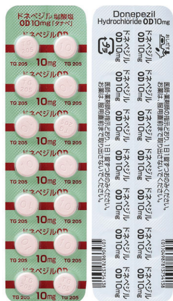
ドネペジル塩酸塩OD錠10mg「タナベ」