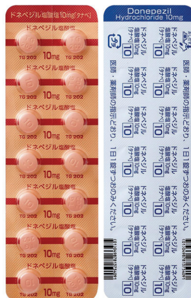
ドネペジル塩酸塩錠10mg「タナベ」