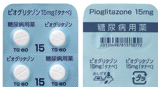
ピオグリタゾン錠15mg「タナベ」