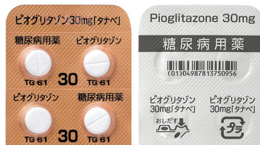
ピオグリタゾン錠30mg「タナベ」